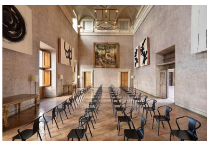
Grand Salon