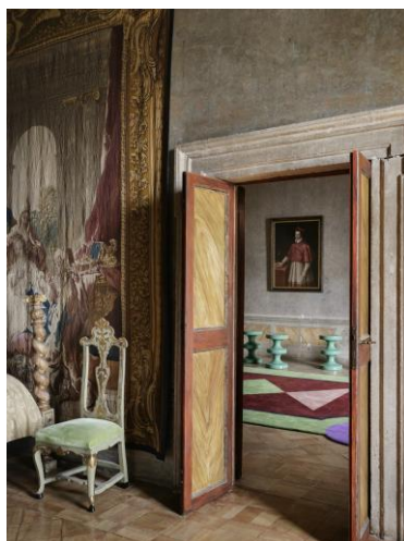
Chambres du cardinal Images : François Halard

En avril 2023, les six chambres historiques du premier étage ont été réaménagées par India Mahdavi, architecte, designer et scénographe. India Mahdavi a proposé une nouvelle lecture où géométries et couleurs occupent une place prépondérante, et a fait appel à des professionnels des métiers d'art français et italiens qui perpétuent des savoir-faire d'excellence tels que la marqueterie de bois, la faïence, le tissage et d'ébénisterie.