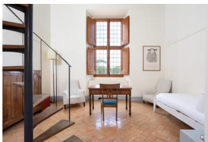
Chambres d'hôtes avant réaménagement

Entre 2023 et 2025 les chambres d'hôtes de l'édifice historique seront confiées à des équipes d'architectes, designers, artistes contemporains travaillant en collaboration avec des professionnels des métiers d'art sélectionnés par le biais de trois concours successifs.